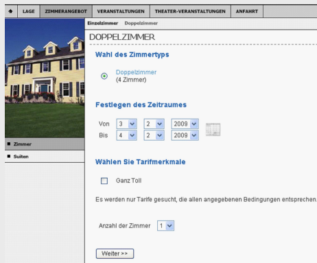
Nahtlose Integration in bestehende Webseiten, wie z.B. web to date.