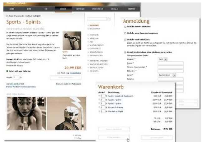
Abbildung 2: Designmöglichkeiten